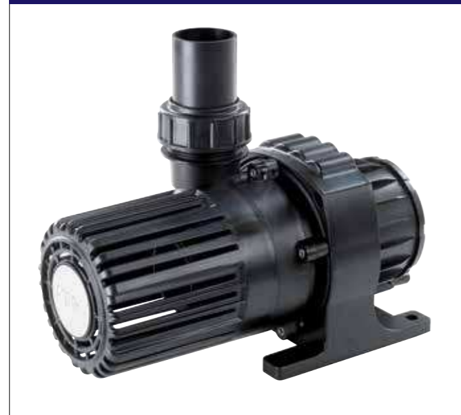
AquaFlow® pompen, moderne techniek met functionele vormgeving.