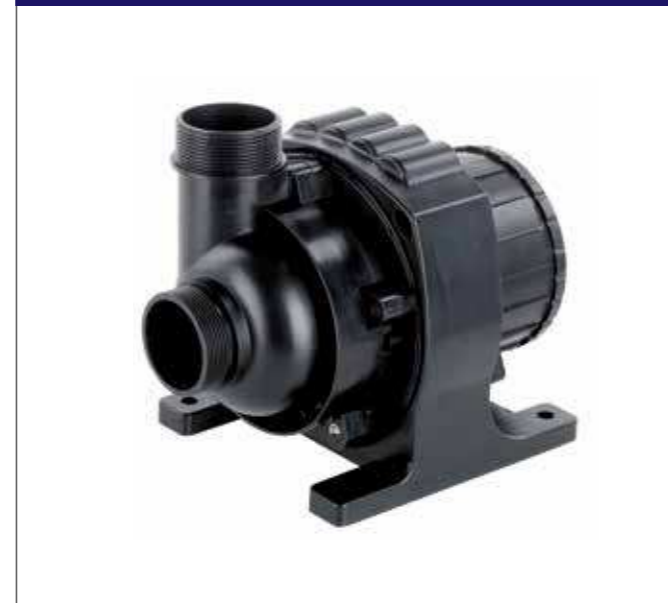
AquaFlow® pompen kunnen droog opgesteld worden onder de waterlijn, door de afneembare zuigkorf.